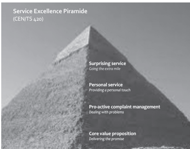
Afbeelding 2: De Service Excellence piramide

De norm onderscheidt vier service-levels die in de Service Excellence Piramide zichtbaar worden. Om te werken aan excellente service heeft een organisatie allereerst haar basisdienstverlening op orde. Aan de impliciete en expliciete verwachtingen van klanten wordt voldaan (' Delivering the promise '). Daarbij is de organisatie zo ingeregeld dat issues van klanten pro-actief worden gemanaged (' Dealing with problems '). Bovendien is de dienstverlening sterk persoonlijk zodat klanten echt contact hebben met medewerkers die echt luisteren, empathie tonen, de klant echt serieus nemen en zich persoonlijk sterk maken om hen van dienst te zijn (' Providing a personal touch '). De hoogste trede van de piramide van Service Excellence gaat over het vinden van ruimte om de verwachtingen van de klant waar mogelijk te overtreffen. Waar regels worden gebogen en waar extra inspanningen worden geleverd om de klant te helpen (' Going the extra mile ').